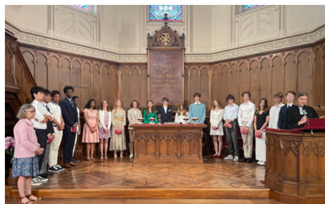
19 catéchumènes confirmant à l'Étoile en 2023

les dimanches 15 octobre, 19 novembre, 17 décembre (culte de Noël des enfants), 14 janvier, 4 février, 10 mars, 5 mai, 2 juin (culte des confirmations)