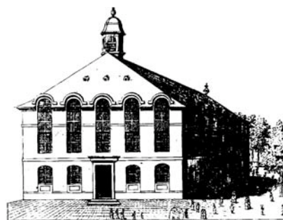
Le temple de Charenton

Compte postal: 173.42F Paris Cpte bancaire :RIB : 30066 10591 00103 36001 Clé:73 Libellé: Association Culturelle de l'Etoile