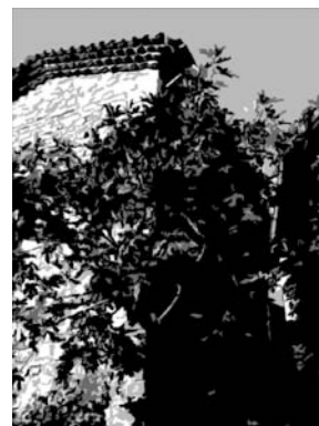
Le Musée du Désert à Mialet dans les Cévennes

L'un des rares lieux de mémoire protestant. Il est à l'origine du grand rassemblement de l'Assemblée du Désert » chaque premier dimanche de septembre. Là, environ 15 000 personnes se réunissent chaque année pour partager un culte en plein air sous les châtaigniers, comme le faisaient naguère les protestants qui n'avaient plus le droit de célébrer leur culte et qui se réunissaient au péril de leur vie au « désert » pour partager la prédication de la Parole.