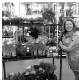
Le nouveau stand Fleurs en préparation avec Mme la Présidente du Conseil Presbytéral.

B ravo à tous ceux qui répondent présents pour que ces journées de Fête et d'Entraide soient attractives, gaies et accueillantes.