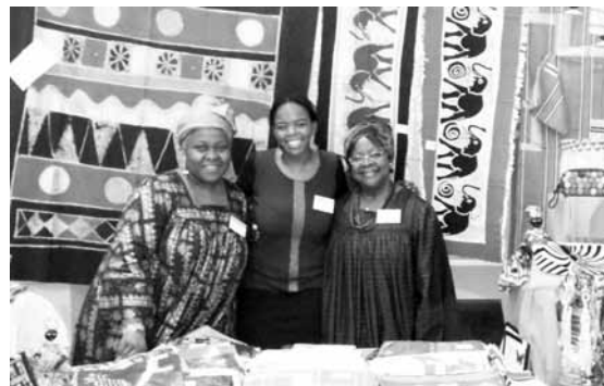
Comptoir Artisanat africain, au centre la lauréate du 1 er prix de la Tombola.