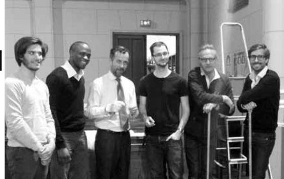
Merci aux gentils déménageurs aux préparatifs et rangement.

• Le rayonnement de notre église et sa capacité à diffuser la parole du Seigneur avec des moyens modernes, actuels via son site Internet qui deviendra facilement consultable sur les tablettes et les smartphones.