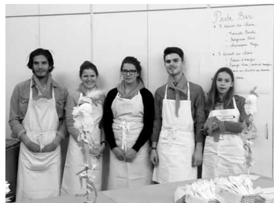
Grand succès du délicieux bar à pâtes et son équipe de choc souriante.

Et comme cette aventure ne s'arrête jamais, nous allons nous retrouver à nouveau pour : Les prochaines journées de Fête et de Vente : Vendredi 13 et Samedi 14 Mars 2015.