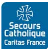
Table fraternelle de l'Étoile avec le Secours Catholique

Depuis le mardi 15 novembre, chaque mardi, de 9 h à 15 h, nous accueillons en lien avec le Secours Catholique, des personnes en situation de grande précarité.